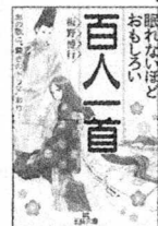
板野 博行著 三笠書房

てください。新しい世界に入るきっかけになるかもしれません。眠れないほどおもしろい百人一首