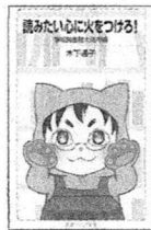
木下通子著 岩波書店

てください。新しい世界に入るきっかけになるかもしれません。眠れないほどおもしろい百人一首