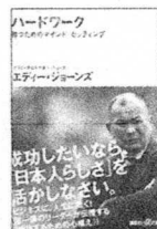
エディ・ジョーンズ著 講談社

2015年に、イングラウンドで行われたラグビーワールドカップで指揮を執られたエディ・ジョーンズの著書。勝負の世界で勝つために必要なことが書かれており、とても勉強になります。