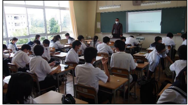
午後も真剣に講座を聞いています