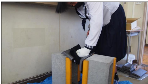
瓦割り用の瓦がどんなものか体験しました