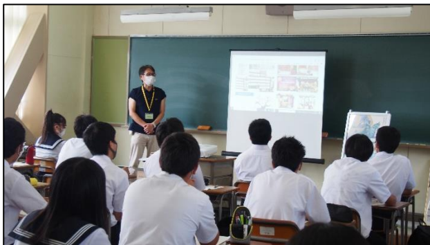
真剣に講座を聞いています