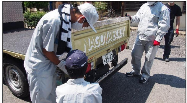
街並みに溶け込む家のデザインについて考えました 2トントラックの荷台を手作業で解体しました